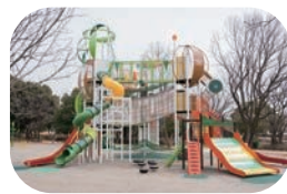
乳幼児向け「ベビサボ」