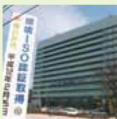
ISO14001環境マネジメントシステム認証取得