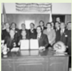
カナダ・ケローナ市と姉妹都市提携