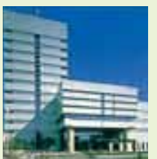
新市庁舎オープン