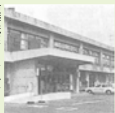
市民文化センターオープン