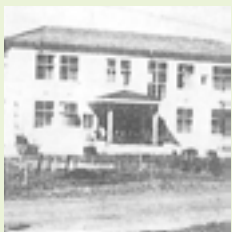
市民病院診察開始