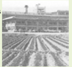
昭和35年完成の市役所庁舎