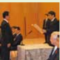
安全・安心なまちづくり活動の功労で内閣総理大臣表彰を受賞