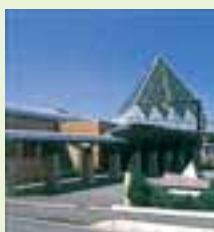
福祉の里レインボープラザオープン