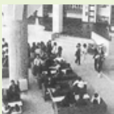
少年自然の家開所