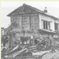
大きな被害をもたらした伊勢湾台風

18年 軍需都市として、勝川町・鷹来村・篠木村・鳥居松村の四か町村が合併し、6月1日に市制施行。市域面積4791平方キロメートル人口5万3709人