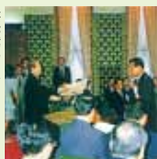
緑化運動功労で内閣総理大臣表彰を受賞