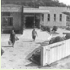
老人福祉センターオープン