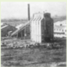
王子製紙春日井工場が操業開始