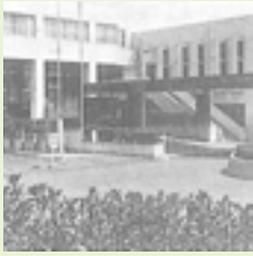
勤労福祉会館開設