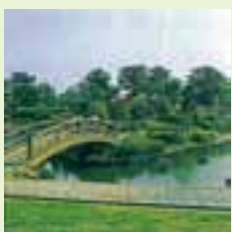
落合公園 日本都市公園 〇〇選に選定

55年 救急医療情報システムがスタート。総合福祉センター(老人・障害者センター)がオープン。