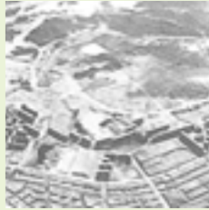
開発進む高蔵寺ニュータウン