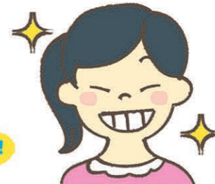
生き生きとした表情をつくる