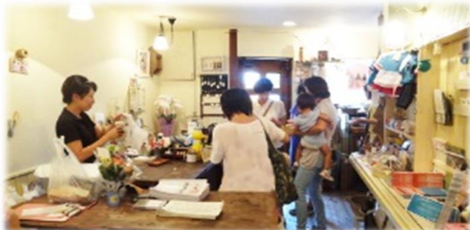
あいち かすがいっこの事務所兼、店内の様子。インタビュー当日の店内はとても賑やかで、お店に集まったママ同士でも会話が弾んでいました。

その想いの結晶ともいえるべき、「ママの文化祭」というイベントを今年2月、初めて開催しました。企業ブース、出店ママブースなどがあり、盛りだくさんで、なんと3,000人以上が来場してくれました。予想を上回る来場者数に感謝の気持ちでいっぱいですが、会場前の大渋滞など反省材料もあったので、次回の平成27年3月26日（木）に、第2回ママの文化祭の開催が決定したので、よりよいものにしていきたいと思っています。