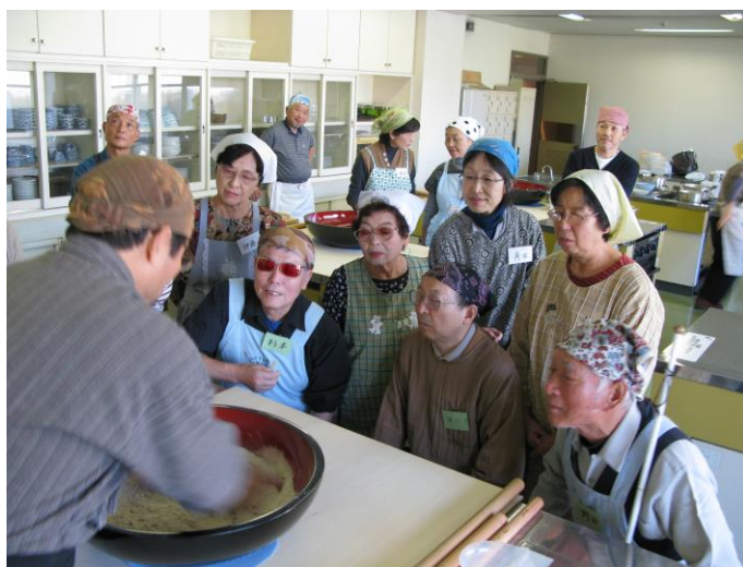
2008年交流会 そば打ち

ボランティアグループ アイ・愛は30年にわたって春日井市内の視覚障害者の方たちに90分の情報テープ「アイ・愛四方山情報」を毎月お送りしています。活動日は第2、第3木曜日、総合福祉センターにて。地元の身近な話題をお届けできるよう、いつもアンテナを張っています。知識や話題が豊富になってとても勉強になりますよ。