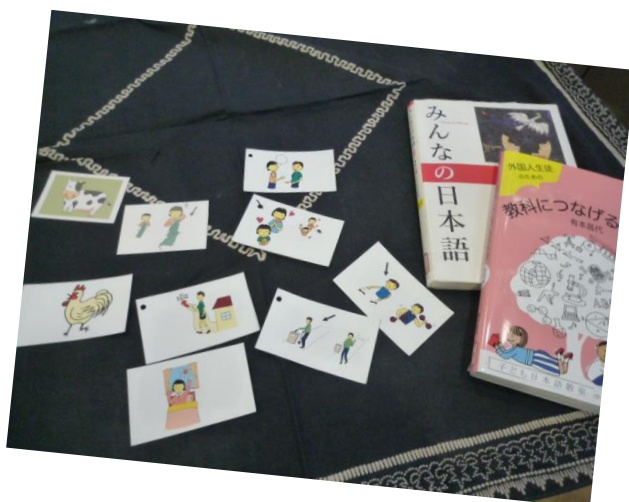
外国の方の生活を支援