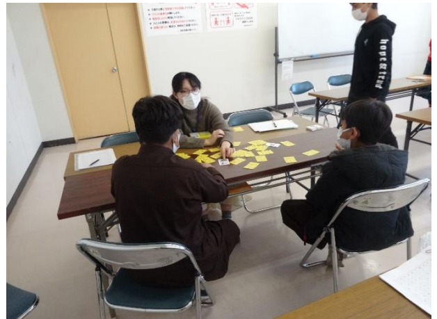
日本語教室の様子