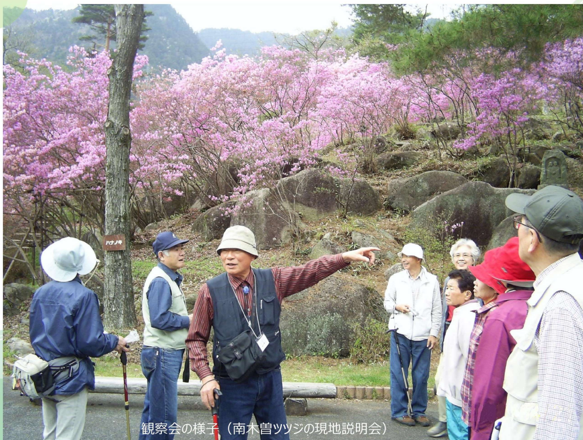
観察会の様子（南木曽ツツジの現地説明会）