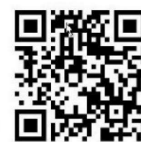
春日井自然友の会 ホームページ

春日井市少年自然の家敷地内にある「野草園」と築水池の「シデコブシ自生地」を中心に保護保全の活動をしています。