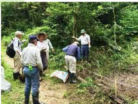
シデコブシ保全作業風景