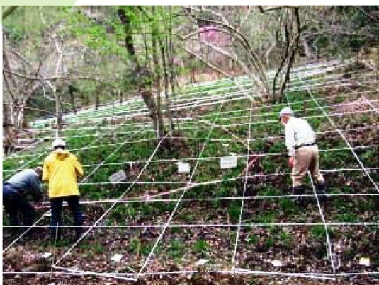
ハリンドウ植生調査風景

この活動は、続けていれば必ず成果が出るところが魅力です。保全作業によって、シデコブシの林床や林縁にはハリンドウやシロバナカザグルマ等の植物が沢山みられるようになりました。また、オオルリやサンショウクイ等の野鳥もやってきます。