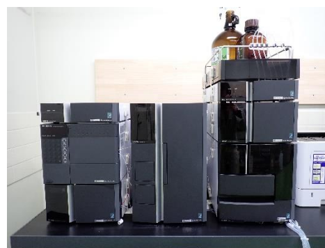
高速液体クロマトグラフ (陰イオン界面活性剤等の測定)