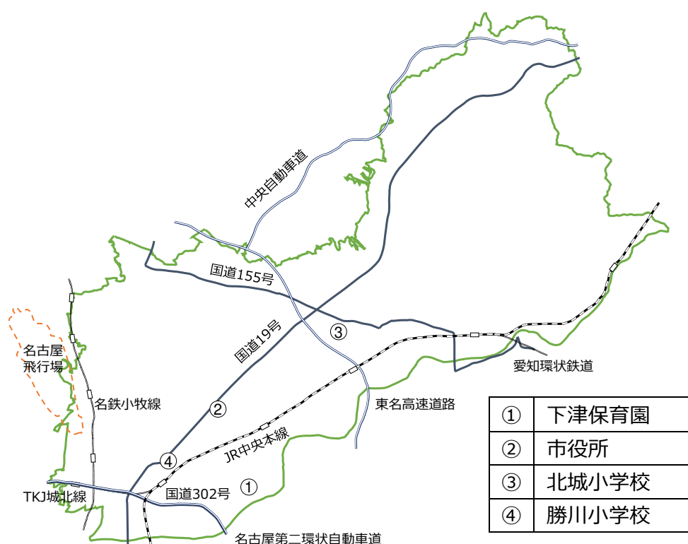
図 1-2 大気中揮発性有機化合物調査地点

令和4年度は、下津保育園、市役所、北城小学校及び勝川小学校の4地点で年4回調査を実施した。調査地点を図1-2に、年平均値結果を表1-4に示す。ベンゼン、トリクロロエチレン、テトラクロロエチレン及びジクロロメタン全て環境基準値を下回った。測定結果の詳細は資料編1-2に示す。