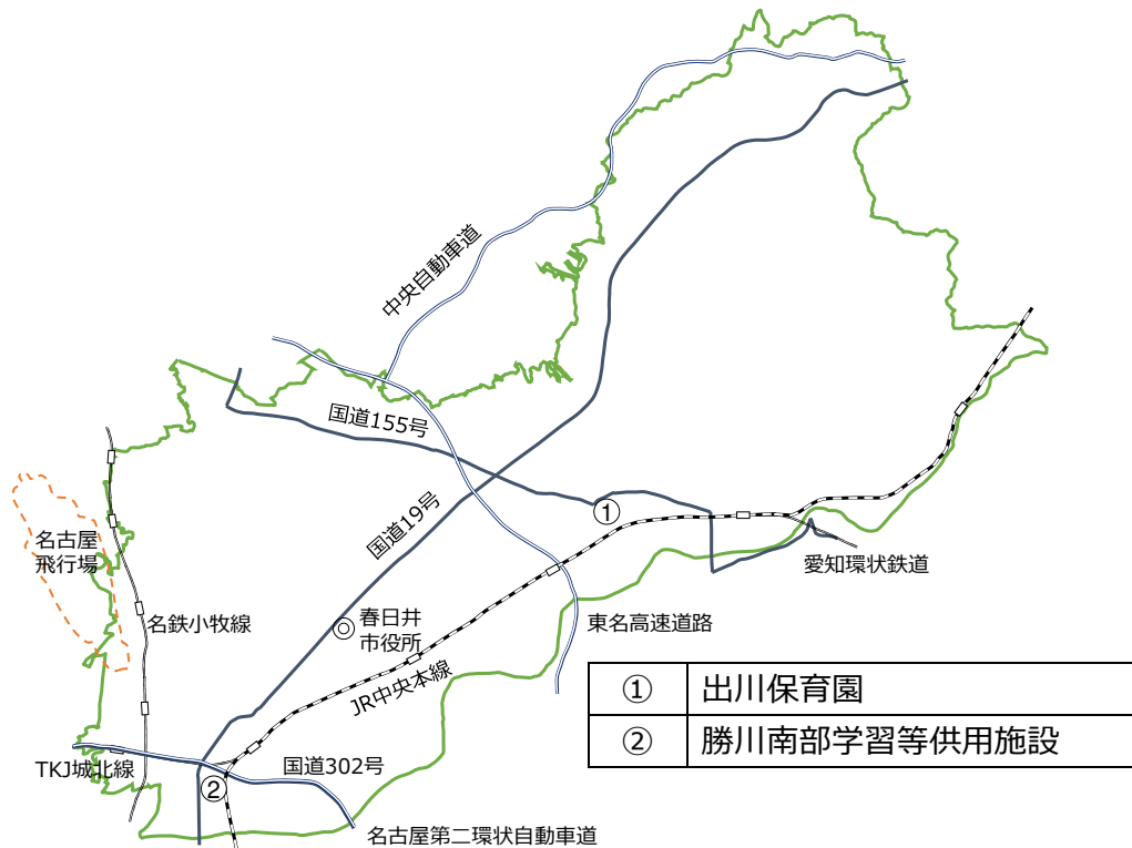
図 1-3 大気中ダイオキシン類濃度調査地点

大気中のダイオキシン類濃度の現状を把握し、継続的な監視を実施することを目的として、現況調査を平成14年12月から実施しており、令和4年度は2地点（年2回）の測定を行った。調査地点を図1-3に、調査結果については表1-5に示す。2地点とも環境基準に適合した。