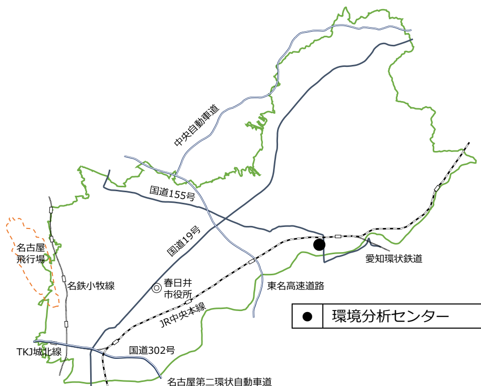
図 1-4 酸性雨調査地点

調査は、約 1 週間毎に降雨の全量を採取し、pH の測定を行った。令和 4 年度の pH の年平均値、年間貯水量及び年間降水量を表 1-6 に示す。月平均値は資料編 1-3 に示す。pH の年平均値は 5.10 で、年間を通じて酸性雨の傾向にある。