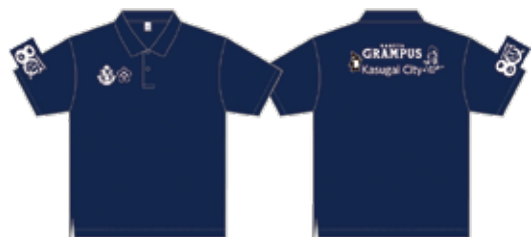
ポロシャツ(カラー：ネイビー)イメージ