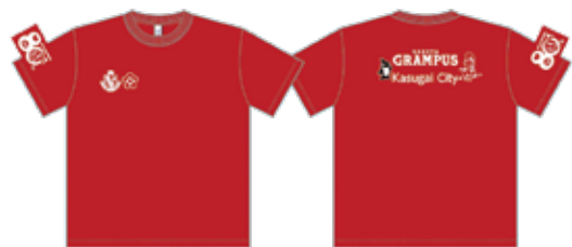
Tシャツ(カラー：レッド)イメージ