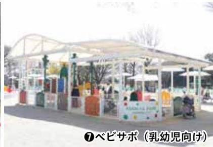
⑨ベビサポ（乳幼児向け）

遊具広場には、市の特産サポテンをモチーフとした子どもの成長に合わせた遊具がそろっています。