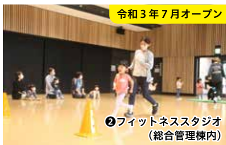
令和3年7月オープン

特徴 全天候型トラックや人工芝、ナイター設備と、陸上競技や球技など昼夜を問わず年中楽しめます。観戦も、メインスタンドとフィールドが近く、より臨場感の高い観戦が楽しめます。