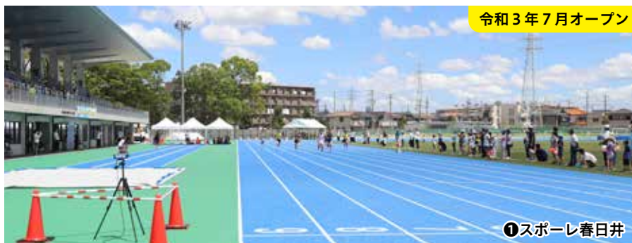
令和3年7月オープン