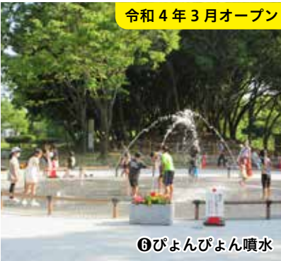
⑥ぴよんぴよん噴水