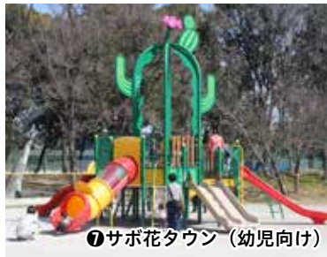
⑧サポ花タウン（幼児向け）