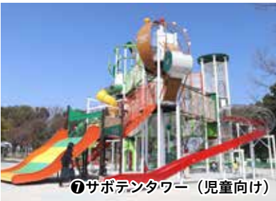
⑦サポテンタワー（児童向け）