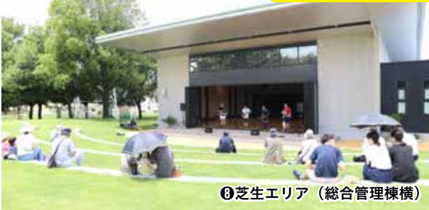
⑩芝生エリア（総合管理棟横）

フィットネススタジオの屋外テラスと連結されており、テラス前は芝生観覧エリアとして楽しむことができます。