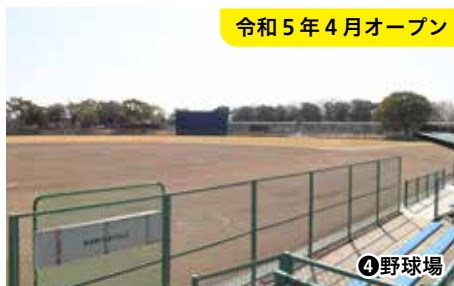
令和5年4月オープン

特徴 少年サッカーコート1面の広さに相当するナイター設備付きの人工芝の広場で、スポーツやレクリエーションを楽しむのに最適です。