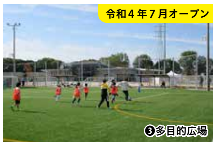
令和4年7月オープン

特徴 一面ガラス張りの開放的な空間で、ヨガやダンス、ピラティスなどが楽しめます。大型の鏡もあり動作チェックにも最適です。