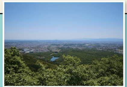
弥勒山山頂からの景色