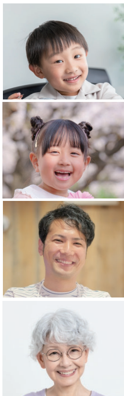
投稿写真のイメージ

募集に伴い取得した個人情報は、取得目的の範囲内で利用し、これらの目的以外には一切使用しません。