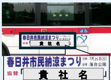
マグネットサイズ(横1,000mm×縦300mm)