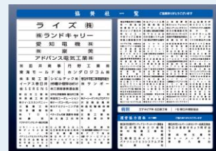
掲載イメージ(昨年度パンフレット) ※レイアウトは協賛社数等により変更となることがあります。