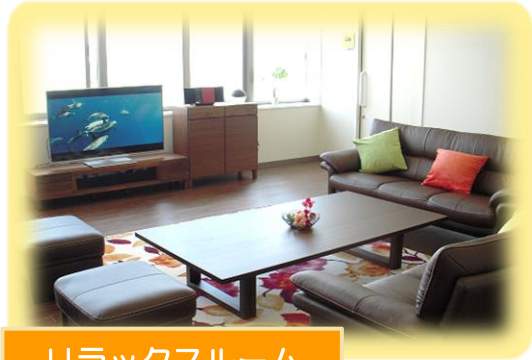
リラックスルーム