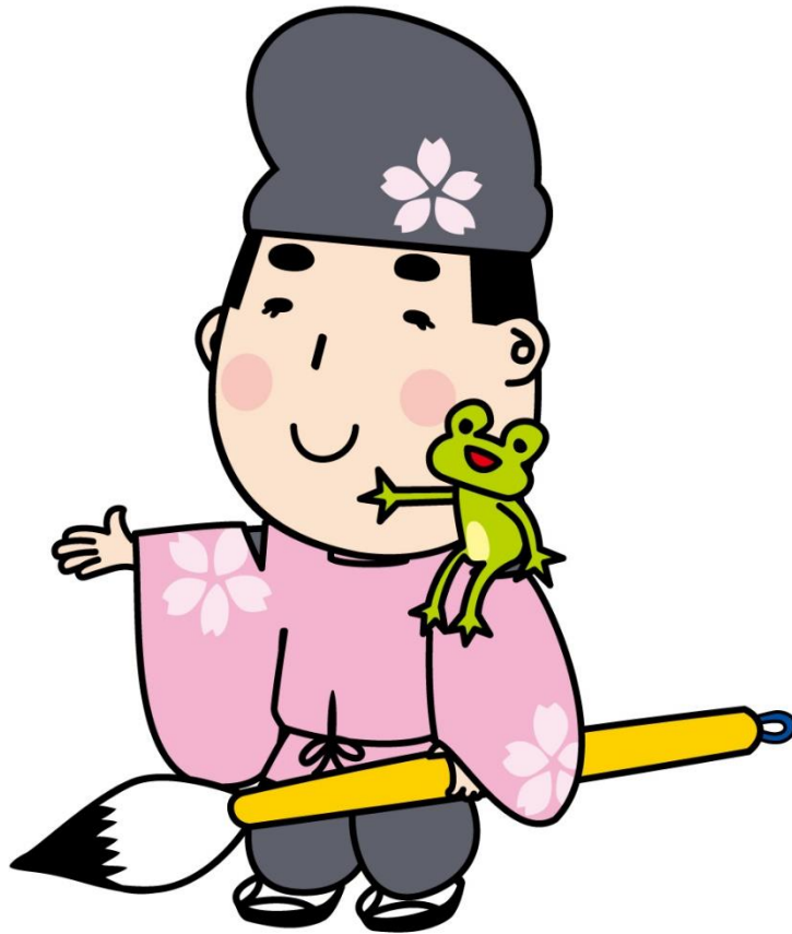
書のまち春日井「道風くん」