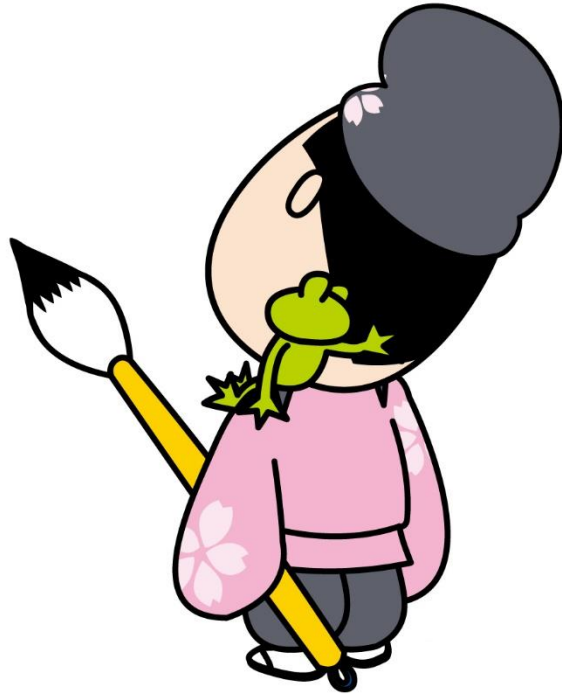
書のまち春日井「道風くん」