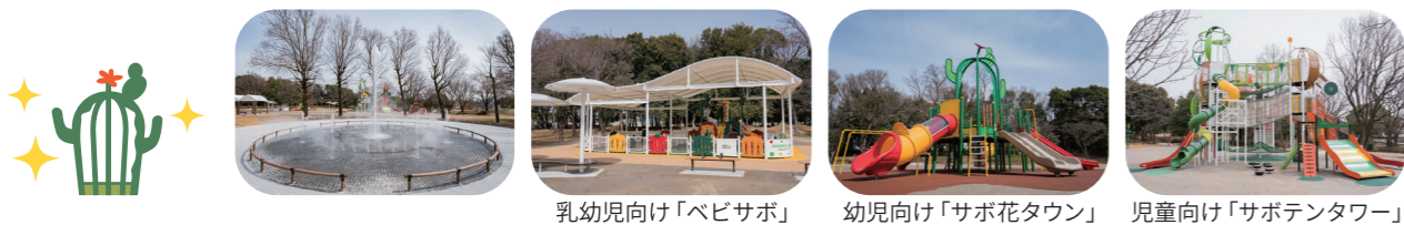
乳幼児向け「ベビサボ」 幼児向け「サボ花タウン」 児童向け「サボテンタワー」

住所: 春日井市朝宮町 4-1-2 時間: 7:00~19:00 (遊具広場) 9:00~17:00 (ぴよんぴよん噴水5月~9月) 休業日: 年中無休 (遊具広場のみ)