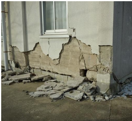
建物全体の破壊・傾斜・変形 壁などへの大きなひび割れ