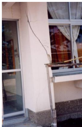
柱へのひび割れ 〔クレジットカードが入る〕 程度のひび割れ