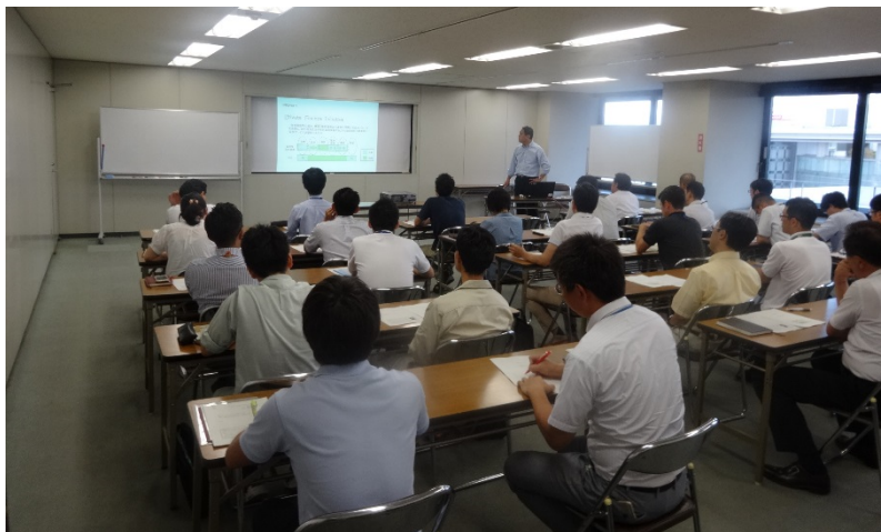
内閣府のPPP/PFI専門家派遣事業を活用した職員向け研修会の様子 (平成27年9月2日実施)

これまでのPFI事業の受注は、大手建設業者が多くを占めています。今後は、地元企業の参画意識を高め、地域経済の活性化を図ることを目的に、先進自治体の講師を招いた研修会などを実施し、市全体の機運を盛り上げる取組を推進していきます。