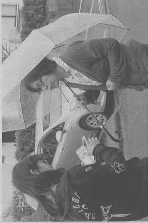
スマホを使い徘徊高齢者を見つける訓練で、高齢者役の人に声をかける協力者の学生(左)―春日井市の高蔵寺ニュータウンで

システムは大手通信会社が開発し、認知症サポートセンターの養成を進める「全国キャラバン・メイト連絡協議会」（東京）が提供を受けて運用する。 運用では捜索の協力者を募り、捜索アプリをそれぞれのスマホにダウンロードしてもらい、徘徊などの行方不明者が出る