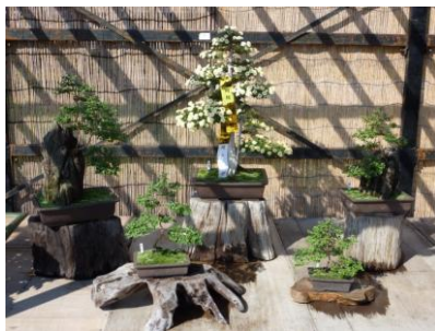
内閣総理大臣賞（山菊自営花壇） 関戸 稔 様