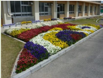
花のまちづくり大賞（団体の部） 丸田小学校