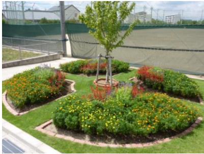
花のまちづくり大賞（団体の部） 出川小学校