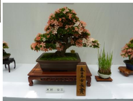
春日井市長賞 木村 公三 様