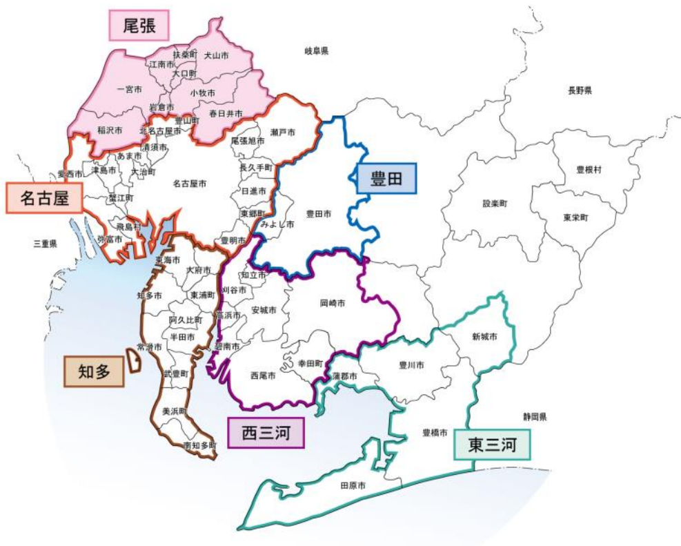
図：愛知県内の都市計画区域