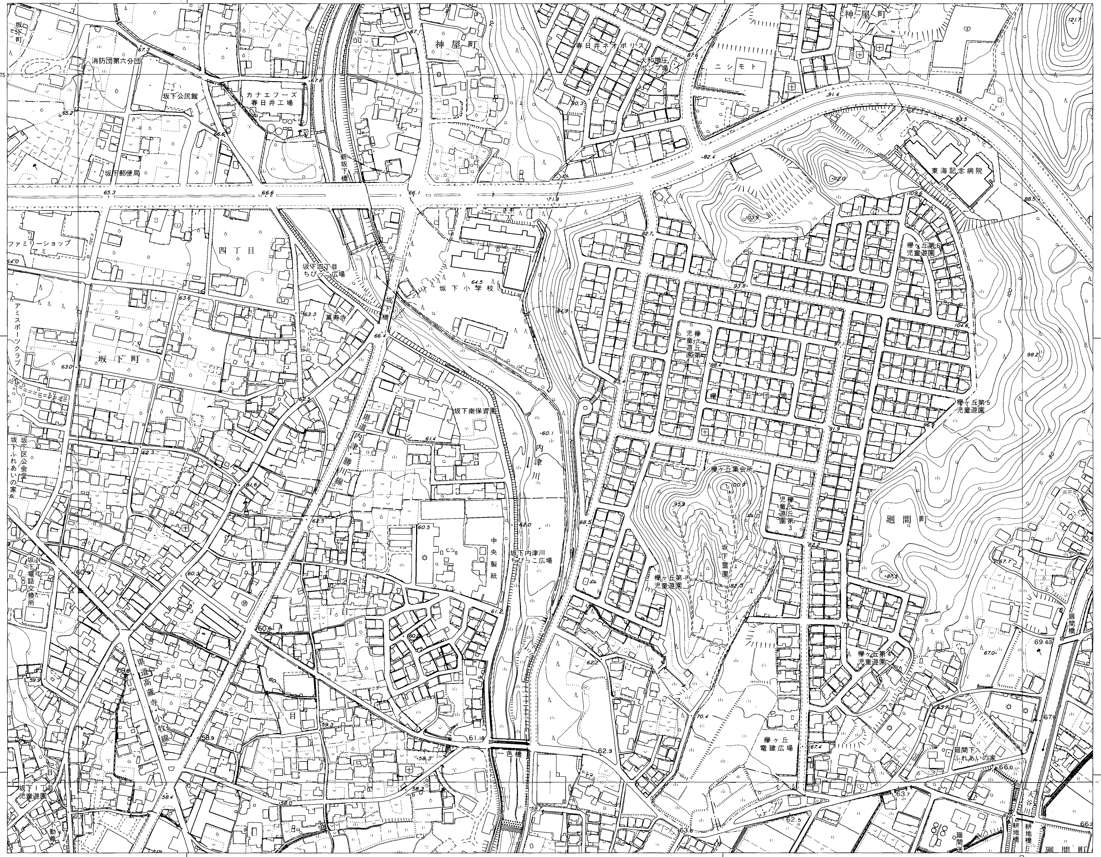
春日井市 (玉野総合コンサルタント)