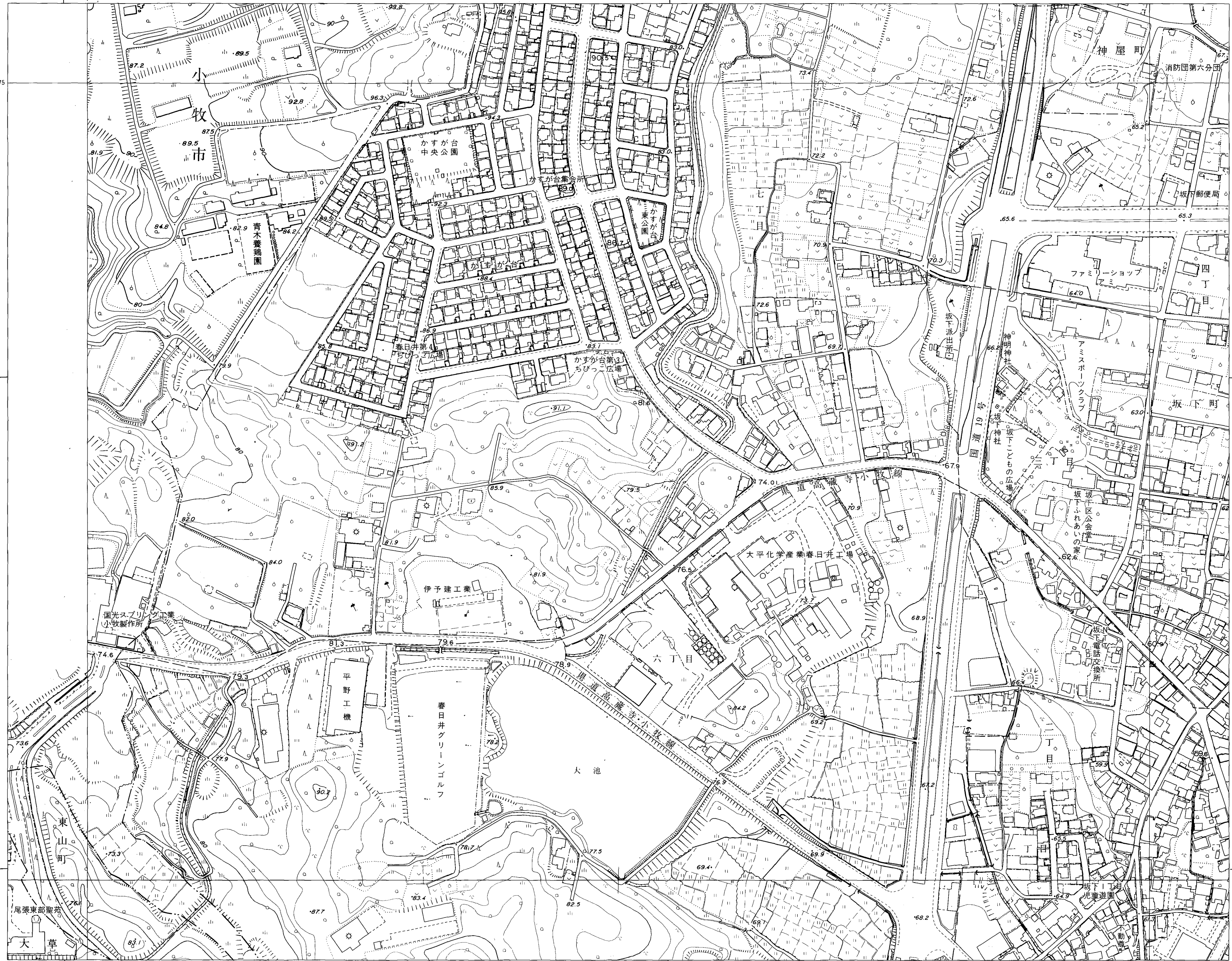
春日井市 (玉野総合コンサルタント)