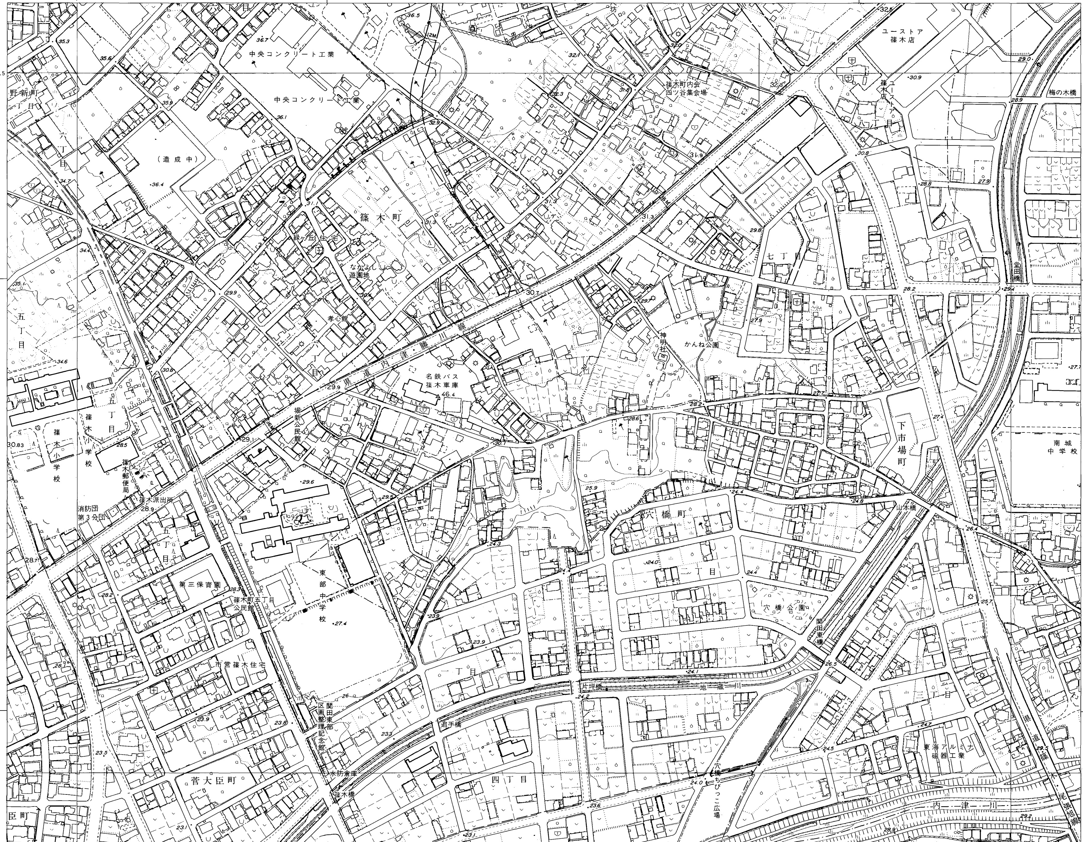
春日井市 (玉野総合コンサルタント)