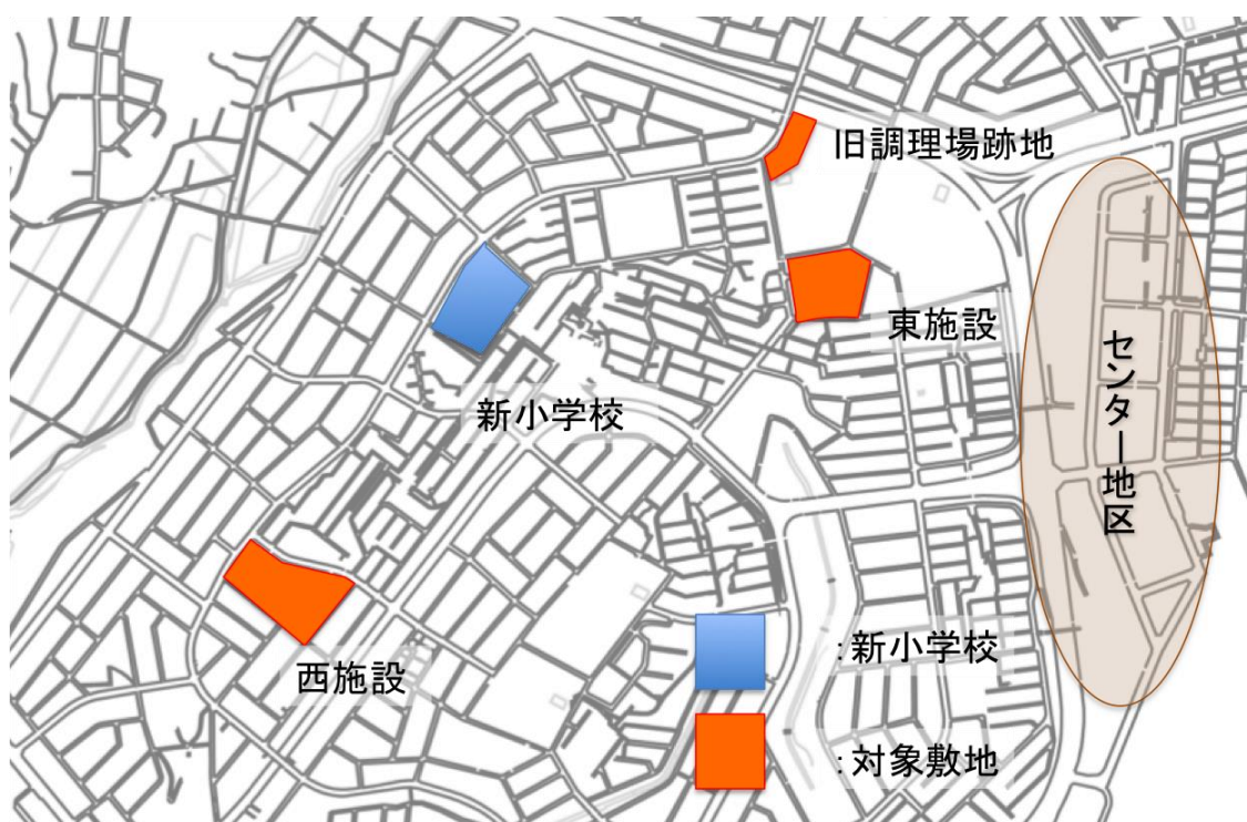
図 1 対象施設の配置

このため、両施設の有効活用を図るための基本的な考え方をとりまとめた基本方針を定め、これに基づく取組を推進する必要がある。