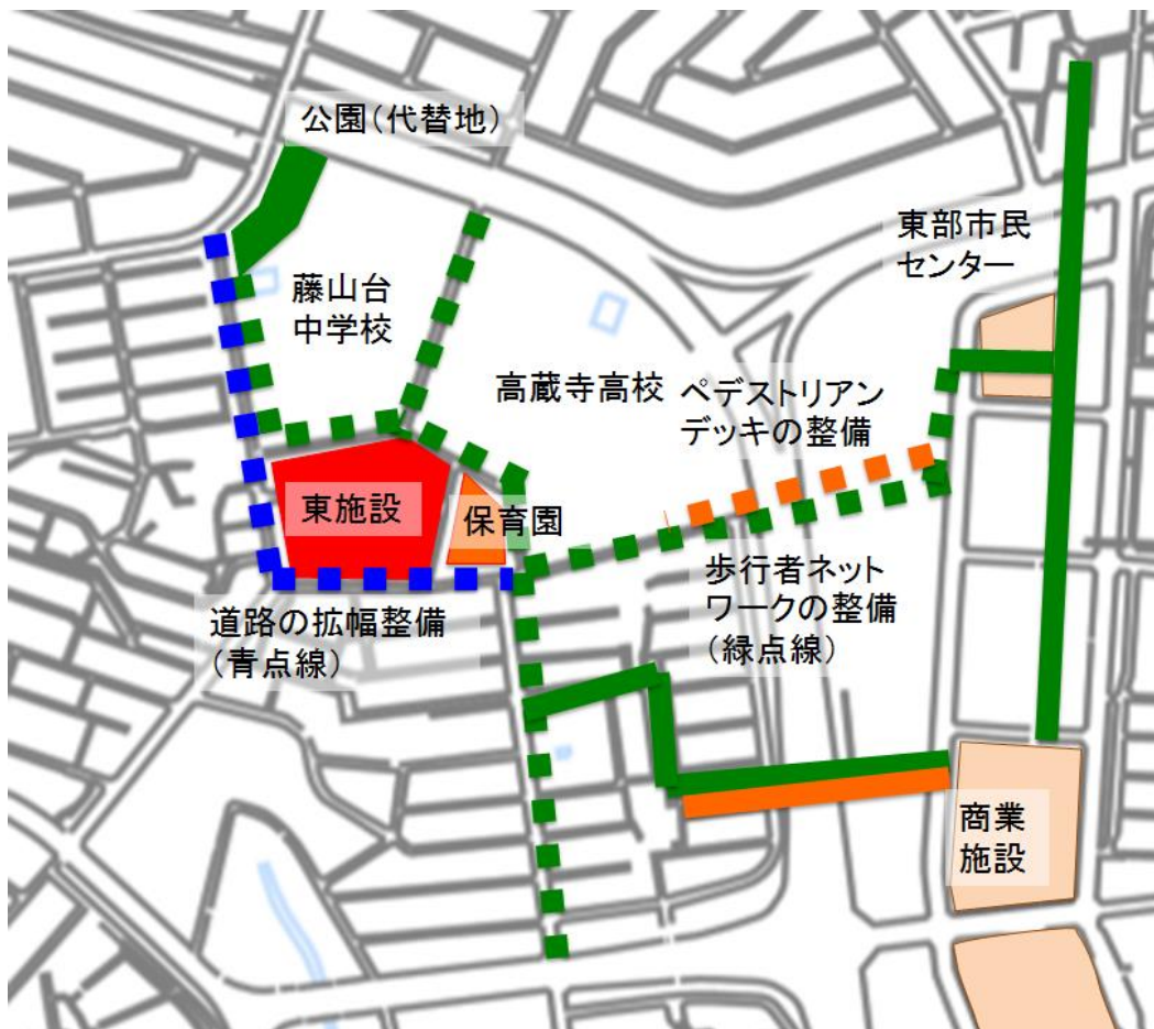
図3 東施設周辺（まなびと交流のセンター）の整備イメージ

「まなびと交流のセンター」には、東施設、中学校、高校、保育園が立地することから、区域内への自動車交通の進入を可能な限り避け、歩道ネットワークで相互に結びつけることが必要である。歩道ネットワークは、将来的にはペデストリアンデッキにより東部市民センターに接続することが望ましい。一方、センターへのアクセスを円滑にするため、周辺道路の一部拡幅を行い、自動車交通の円滑化を図るとともに、東施設及び保育園の利用者のために必要な駐車スペースを区域内の交通安全を阻害しない場所に適切に確保することが必要である。