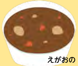
えがおの カレーシチュー