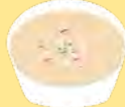
じゃがいもスープ