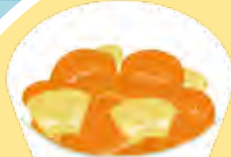
フルーツミックス