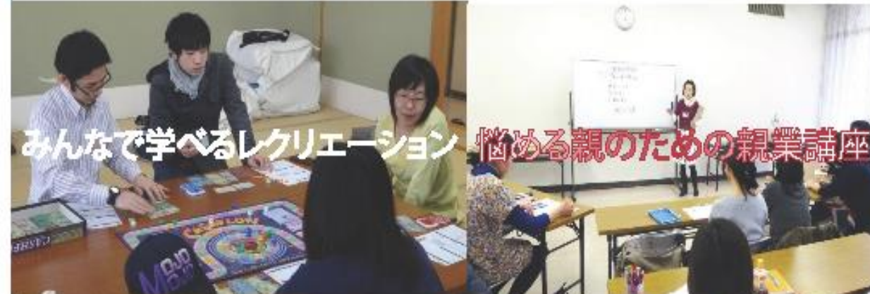
みんなで学べるレクリエーション 悩める親のための親業講座