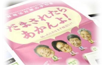
愛知県からの資料も配っています。