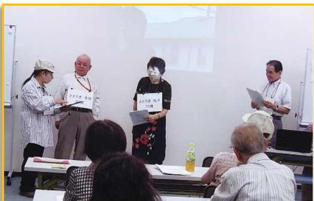
講演会の様子。メンバーが役になりきって演じます。

老人会や町内会の依頼があるときは、これまで会で集めた数々のトラブル情報や事例を寸劇やクイズにしてみたり、替え歌を皆さんと合唱したりと、工夫をこらしたメニューを準備し「トラブルに気づいてもらう」キッカケ作りをしています。