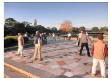
(落合公園でラジオ体操)

☆ 特別イベント(日帰り・1泊)として、近隣のウォーキングコースを歩いております。(年間5回ほど)