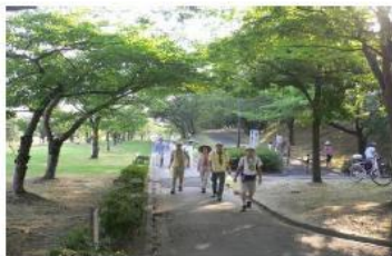
(朝宮公園を目指して出発)

60歳代の壮年男女(会員数80名ほど)が、語りながら散策気分です歩いております。