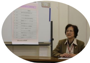
ボランティアの心得