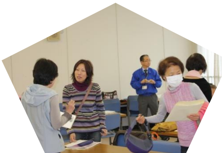
交流会タイム(任意)