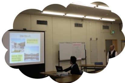
パワーポイントを使って説明する団体も