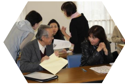
興味のある団体の話を聞けます

申込み：ささえ愛センター56-1943 まで電話か、住所・氏名・年齢・電話番号を記入して、FAX：56-4319 または Eメール： sasae-i@city.kasugai.lg.jp まで