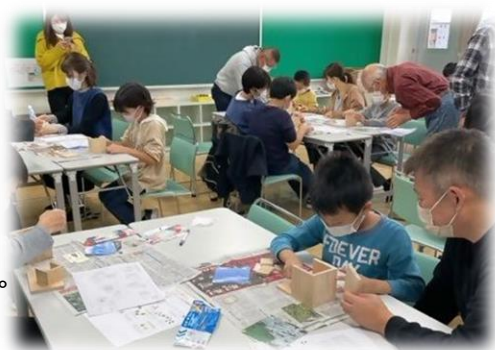
(どんぐりs カフ ホエ教室)