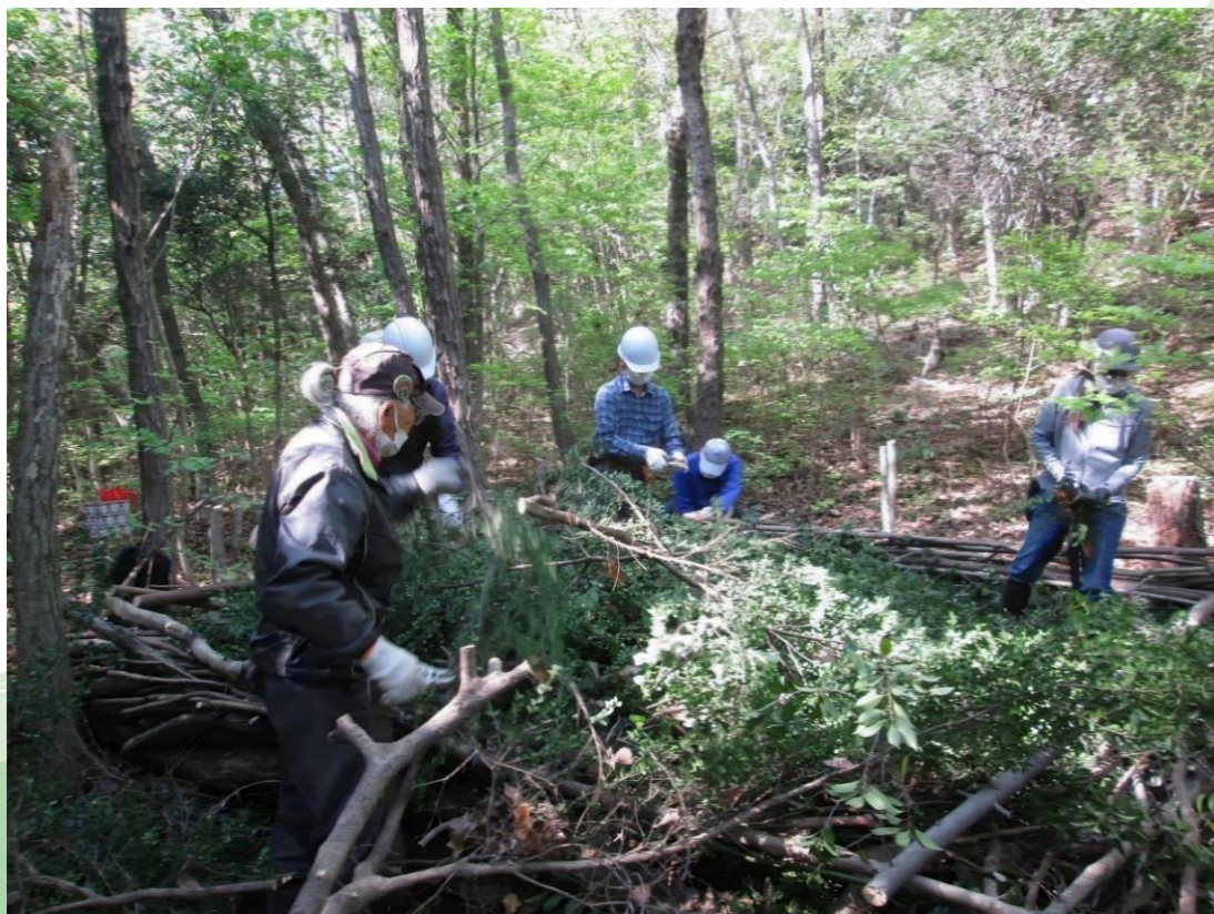
高森山の里山整備のようす