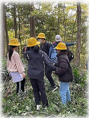
(高森台小の校外学習)

活動を通じて一番やりがいを感じるのは、子どもたちがこの里山に来て、わいわい騒ぎながら楽しんでいる姿をみることです。このところ、そういう子どもたちが増えてうれしく思います。