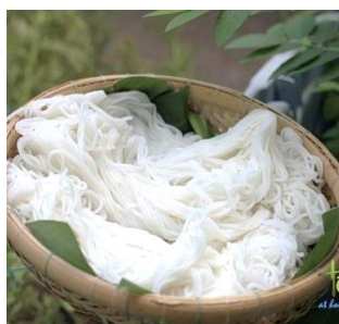
米の粉から作られる麺