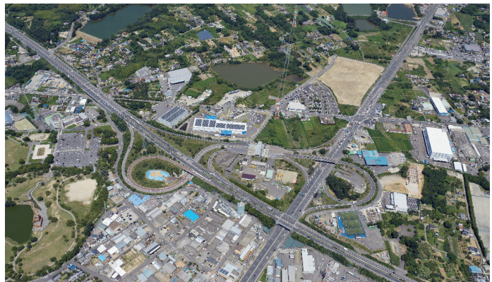
春日井インター チェンジ付近