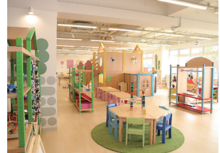
グリーンパレス春日井の子ども屋内遊び場「ぐりんぐりん」