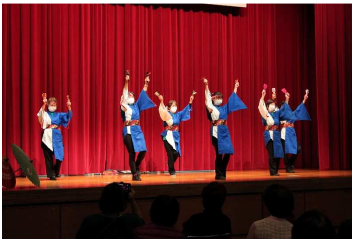
活動団体による発表