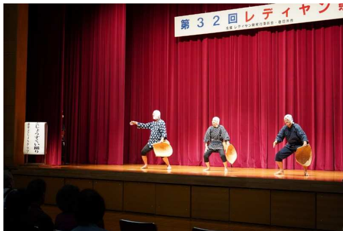
活動団体による発表