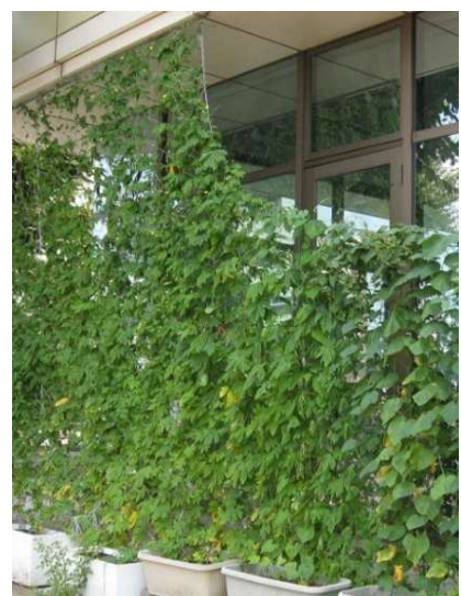
今年も緑のカーテンを育てます。