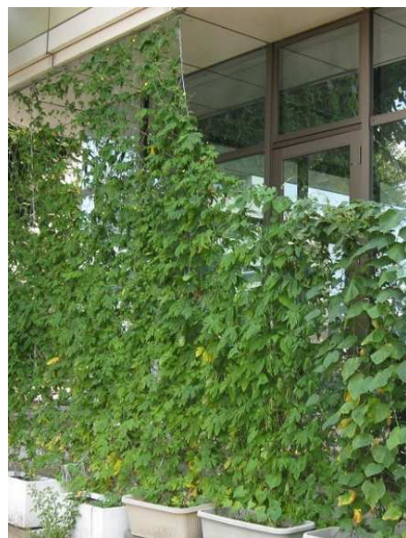
今年も緑のカーテンを育てます。

5月から10月まで、節電対策として、職員はノーネクタイ、軽装による勤務を実施します。ご理解いただきますようお願いいたします。