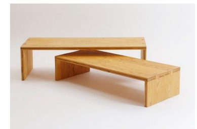
約450mm×1,400mm 2セット（計4台）製作

コミュニティカフェのえんがわルームの畳小上がりの上で利用者が実際に使うテーブル（ちゃぶ台）を製作するワークショップを開催するもの。 対象者：親子15組（30名程度） 場所：旧西藤山台小学校施設