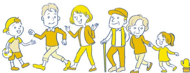
暮らしやすさと幸せをつなぐまち かすがい