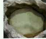
破砕・選別したガラス