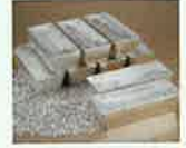
有用金属(銀)のイメージ