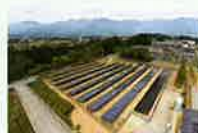
リユース品を使用した発電所