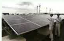
太陽光発電設備の検査の様子

使用済みとなった太陽光 パネルには、再販売可能な ものもあり、既に多くのリ ユース事例が報告されて います。