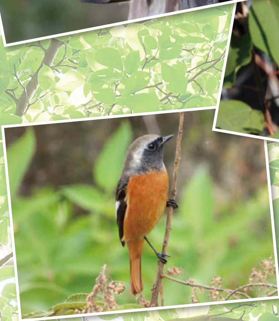
タイトル「上:おいしいね。中:カワセミ(翡翠)下:帰ってきたジョウビタキ」