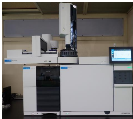
ガスクロマトグラフ質量分析計 (フェノール類等の測定)