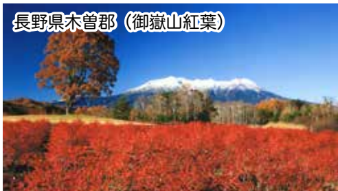
長野県木曾郡 (御嶽山紅葉)