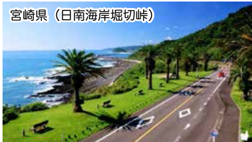
宮崎県 (日南海岸掘切峠)