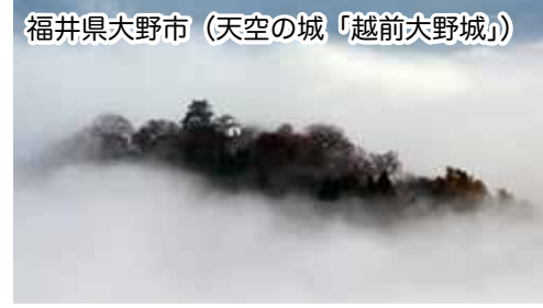
福岡県大野市 (天空の城「越前大野城」)