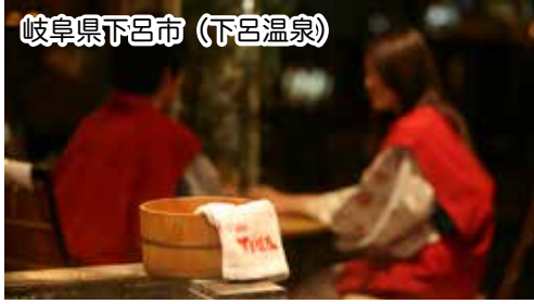
岐阜県下呂市 (下呂温泉)