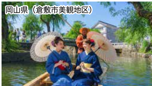
岡山県 (倉敷市美観地区)