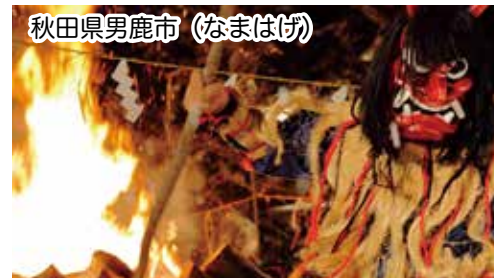
秋田県男鹿市 (なまはげ)