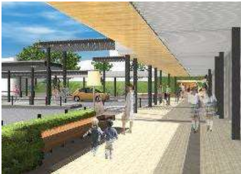
道路、広場(イメージ)