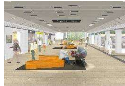
ベンチ・テーブル(イメージ)