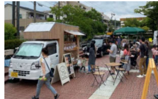
食事・購買施設(イメージ)