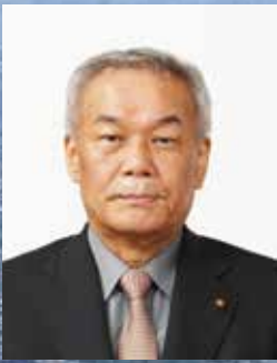
春日井市議会議長 友松 孝雄

結びに、1日も早い新型コロナウイルス感 染症の終息と、新しい年が皆さまにとって、 光り輝く素晴らしい年になりますよう心から お祈り申し上げます、年頭のあいさつとさ せていただきます。