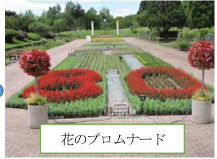
花のプロムナード