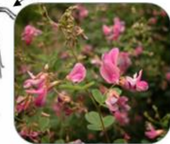
ミヤギノハギ ヤマハギ