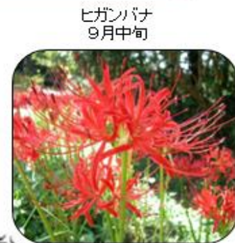
ヒガンバナ 9月中旬