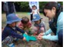
あそびむしくらぶ