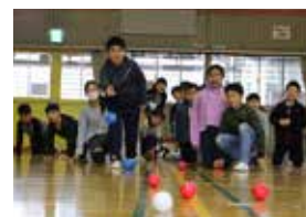
【ボッチャを体験しよう】