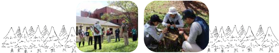
【野外活動・自然体験指導者講座】