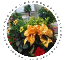
【おしゃれ園芸教室】 ※花材は変わります